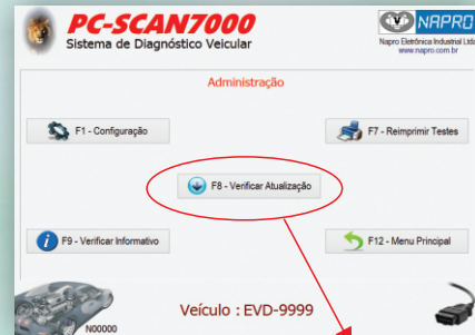
F8 - Verificar Atualizações

As novas versões, inclusões de novos sistemas, devem ser adquiridas via DVD.